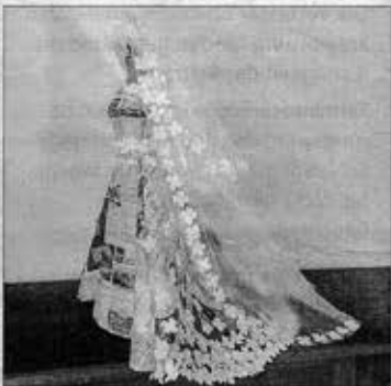
Patricia Jacomella Bonola «Ephemeres Monument».